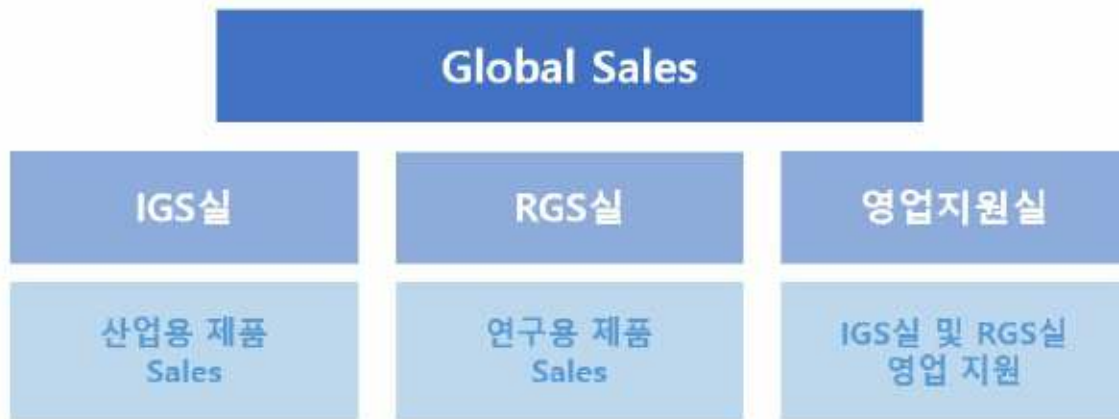
Global Sales 조직도

당사의 글로벌영업부는 전세계에 당사 제품의 판매업무를 담당하고 있습니다. 영업 지원실은 국내시장의 제품판매 및 영업/수출지원을 담당하고 있으며, Research Global Sales 실은 전세계 판매망을 관리하여 주로 연구용제품의 해외판매를 담당하고 있습니다. Industrial Global Sales 실은 전세계 산업용제품 수요고객들을 상대로 영업 활동을 담당하고 있습니다.